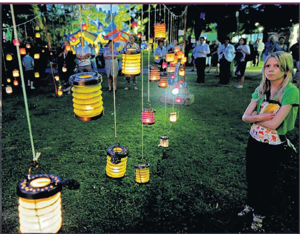
Sfeerbeelden van het Toon Hermans Humor Festival.