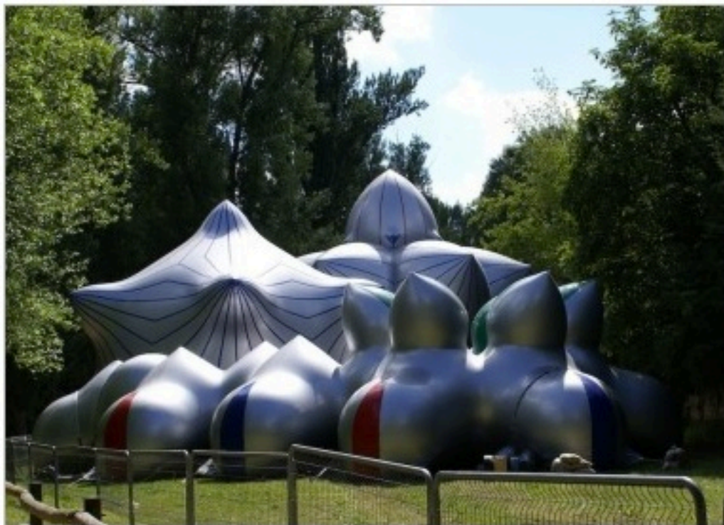
Exterior de la Carpa Mirazozo

La Carpa Mirazozo, instalada en el Paseo de la Alameda del Parral, podrá visitarse a partir del 9 de junio a las 16:00 horas.